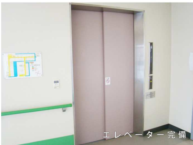
エレベーター完備