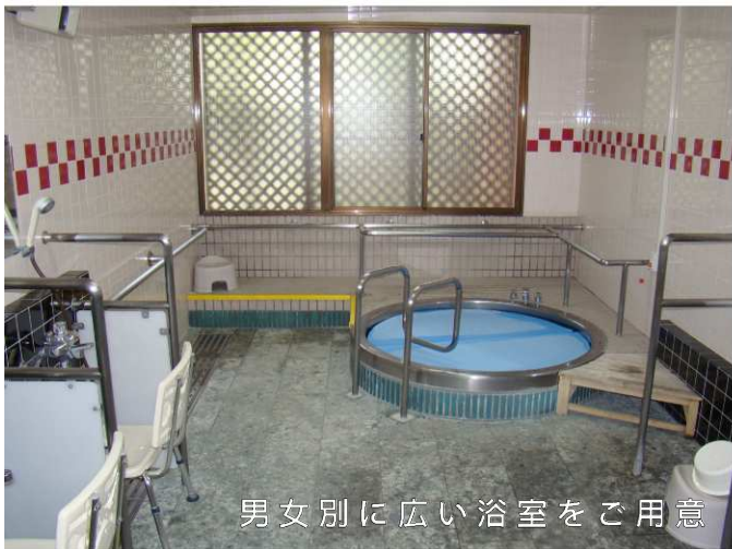
男女別に広い浴室をご用意