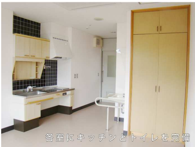
各室にキッチンとトイレを完備