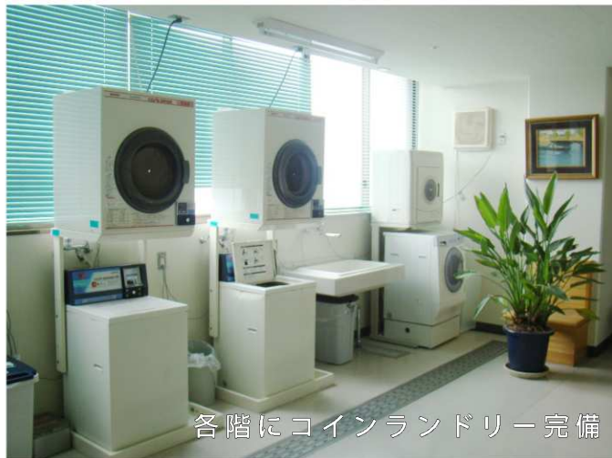
各階にコインランドリー完備